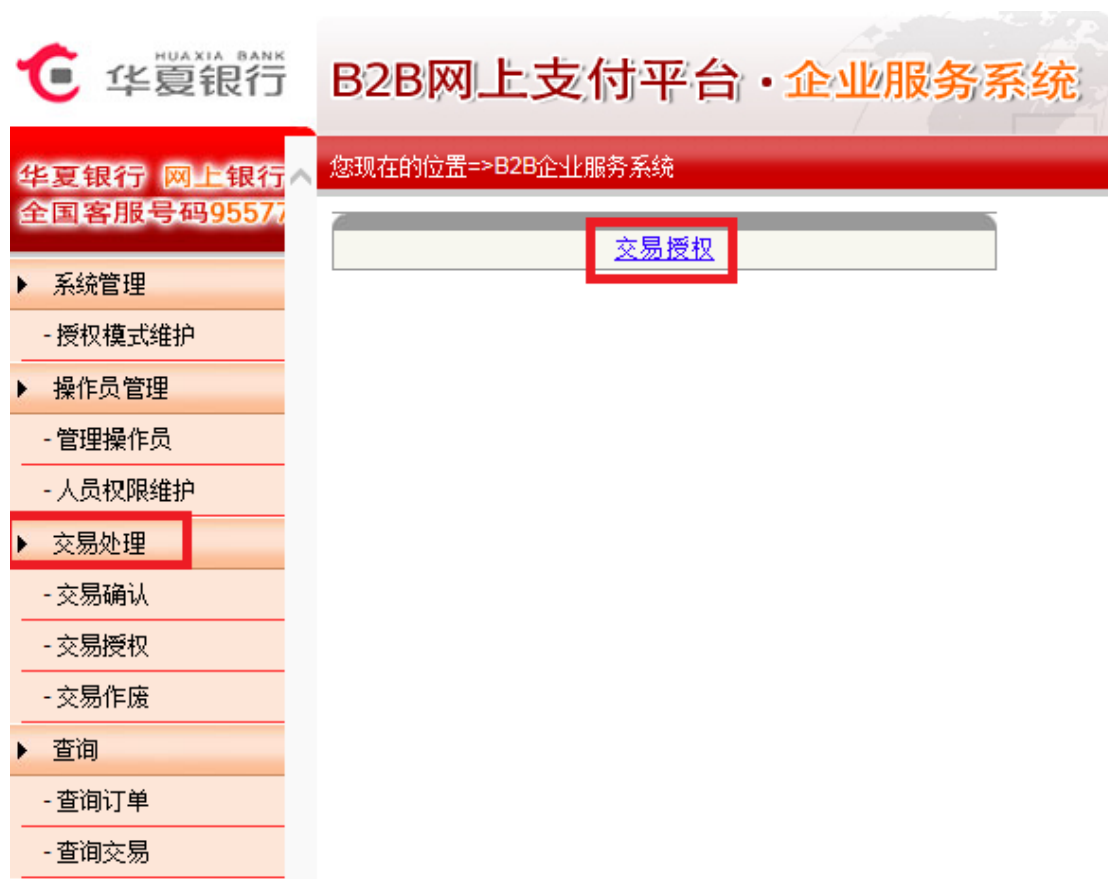
待授权的交易列表